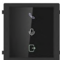
Sinottico di Stato