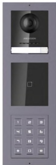
Postazione esterna modulare